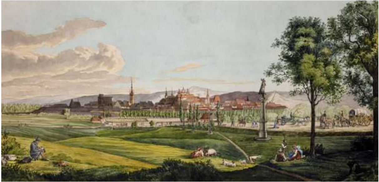
Akvarel Jakoba Hyrtla z roku 1835, uložený ve sbírkách Vlastivědného muzea v Olomouci, inv. č. O-144, rozměry: 43,5 x 21 cm

Kalvárii, která stála patrně až u Křížového pramene 8 , Jakub Hyrtl na svém akvarelu nezachytil.