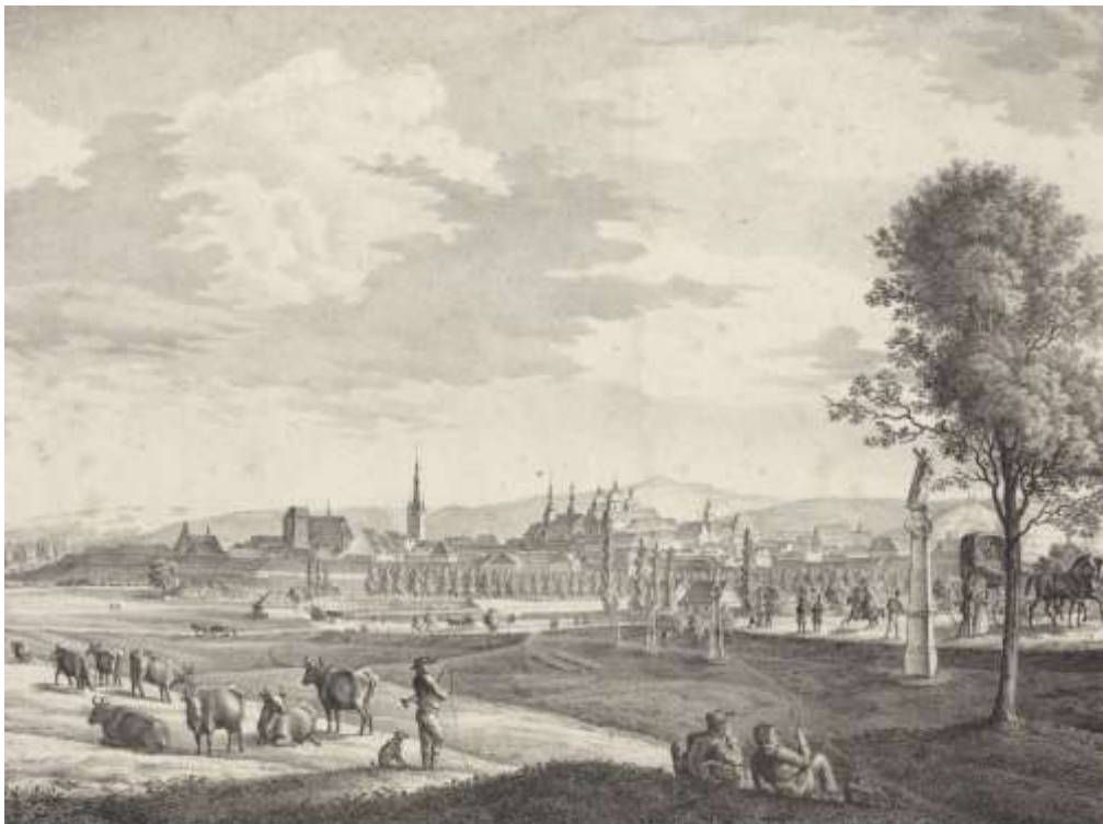
Uloženo ve sbírkách Vlastivědného muzea v Olomouci, inv. č. O-143 a O-580. Rozměry: 34 x 40,6 cm

Akvarel Jakuba Hyrtla byl například předlohou litografií J. Trunze z druhé třetiny 19. století, která byla vydaná olomouckou tiskárnou Skarnitzl a Domek: