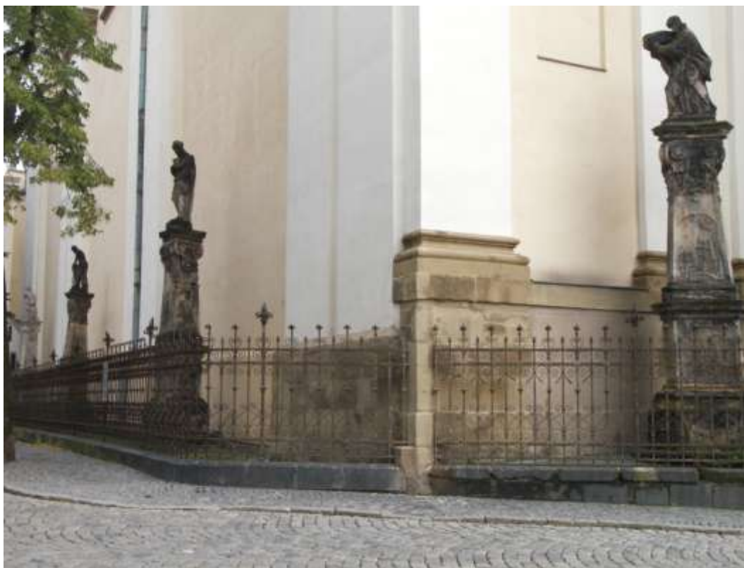
Celkový pohled na současné umístění Bolestného růžence při kostele sv. Michala v Olomouci