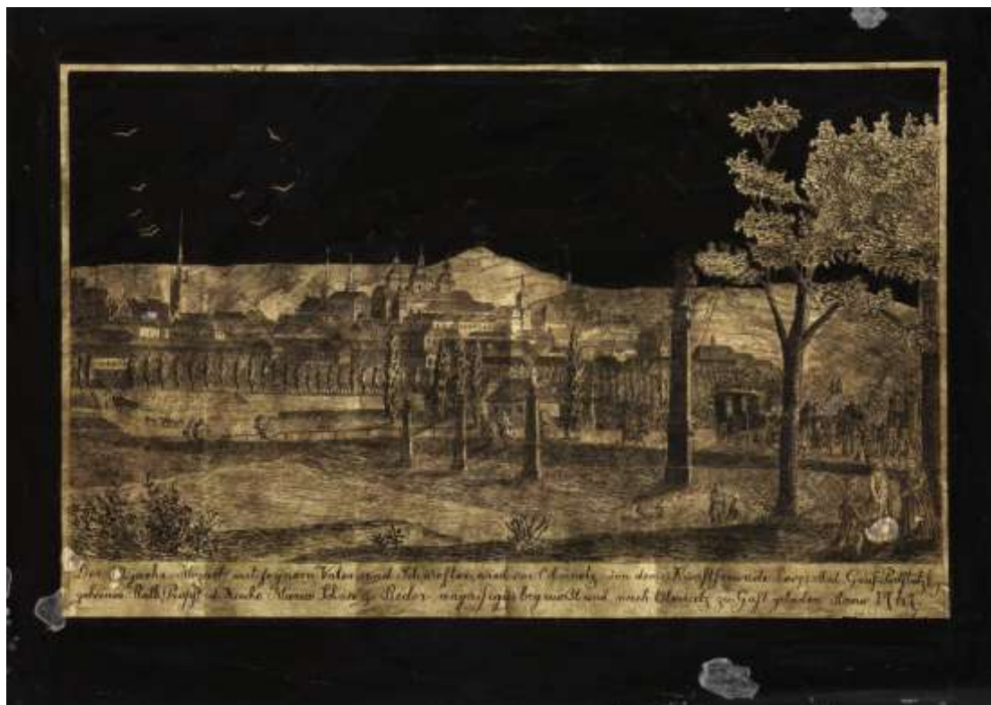
Uloženo ve sbírkách Vlastivědného muzea v Olomouci, inv. č. O-101, Rozměry: 37,5 x 21,5 cm

Pro zachování sochařských děl Bolestného růžence byla založena fundace, která byla vytvořena za účelem realizace obnov 10 . O špatném stavu sochařských děl vypovídá dopis, adresovaný městské radě a podepsaný kanovníkem Leopoldem Antonínem, hrabětem Podstatským 30. června 1763 11 . V něm pisatel žádá o zajištění opravy poškozených sochařských děl z existující fundace, líčí znepokojení lidí, kteří kolem nich procházejí. Podle sdělení magistrátu v roce 1890 byla fundace nezvěstná 12 a později došlo k zásadnímu rozhodnutí soubor sochařských děl prodat 13 . V roce 1904 odkoupil sochařský cyklus farní úřad u sv. Michala a z iniciativy faráře Panáka byla sochařská díla přenesena ke kostelu sv. Michala. Páté zastavení, tzv. Kalvárie, bylo bohužel při přenesení poškozeno a své nové místo, kterým měl být olomoucký hřbitov, nezískalo. Bylo prodáno olomouckému kameníkovi, jehož jméno nám není známo. 14