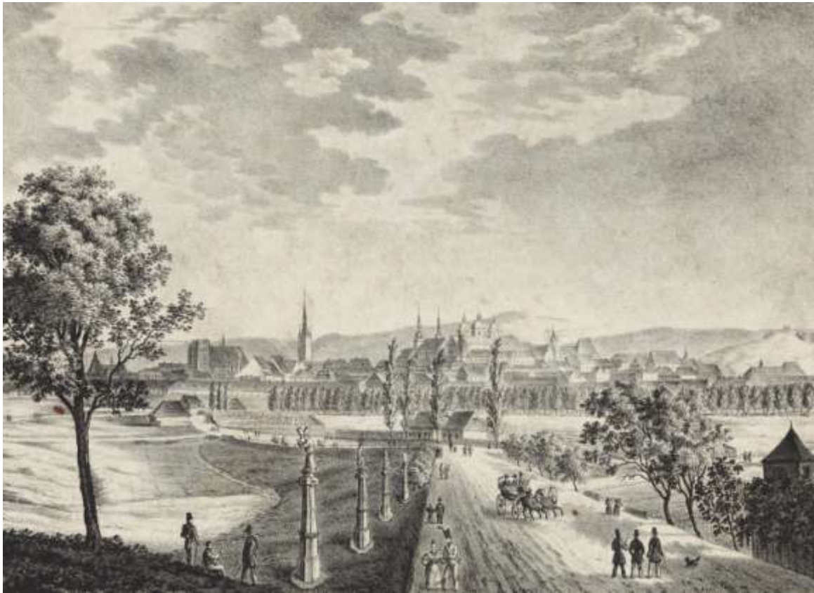
Uloženo ve sbírkách Vlastivědného muzea v Olomouci, inv. č. O-169, Rozměry: 21,1 x 15,3 cm

Z druhé třetiny 19. století rovněž pochází litografie neznámého autora, vydaná olomouckou tiskárnou Skarnitzl a Domek: